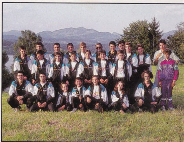
El equipo español obtuvo una brillante segunda posición