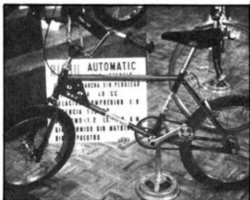
También Rieju presentaba este modelo para trial-sin, de aspecto muy ligero. Con un diseño que podríamos calificar como clásico en esta especialidad.