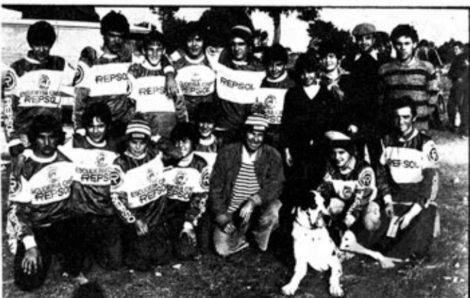
El popular trialista «Fiti» llevó a esta segunda prueba del Triangular una completa formación de 16 pilotos encuadrados dentro del Club Trialsin Las Rozas.